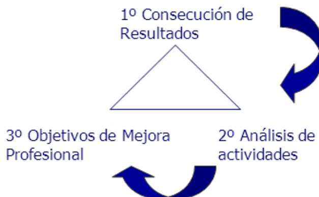
Cuadro 9 – Proceso Evaluación

Proponemos unas entrevistas de feedback compuestas de tres fases: