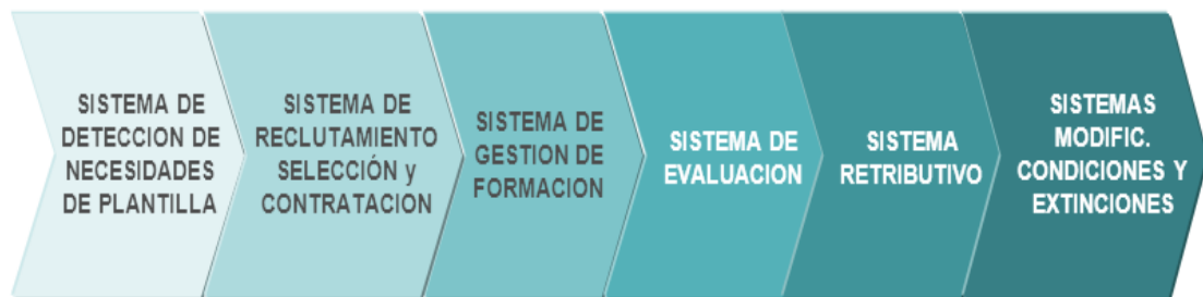
Cuadro 6 – Proceso RRHH

Los sistemas de RRHH los presentamos como un proyecto en cadena, como un proceso, nunca como conceptos individuales. Todos se relacionan entre ellos y dependen los unos de los otros. A continuación, en el cuadro 6, vemos el esquema del proceso.