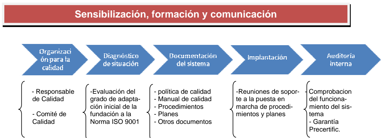
Esquema 3. Proceso de implantación de ISO 9001 en una fundación